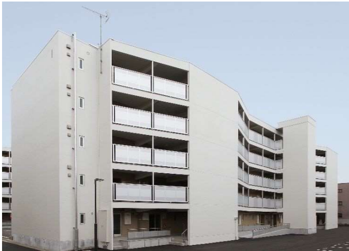
公営住宅における景観改善事業