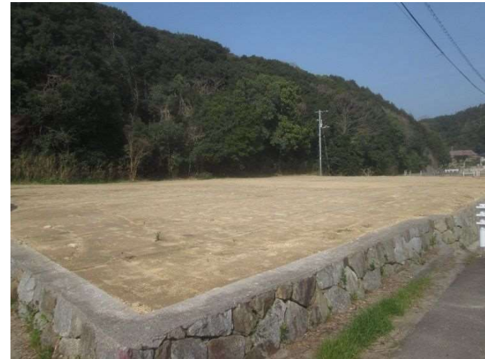
老朽化した危険空き家の除却