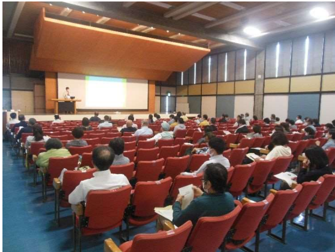
空き家対策セミナーの開催