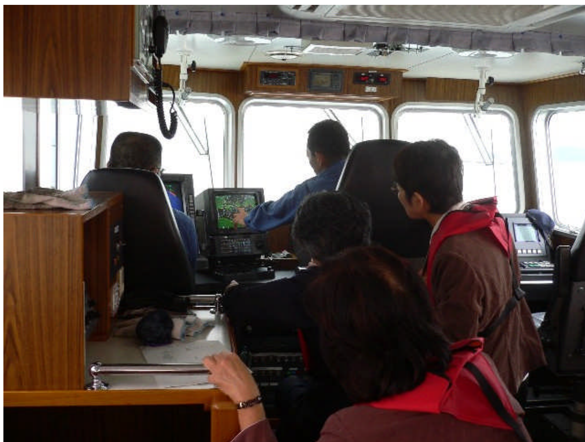
やくり 船内の様子