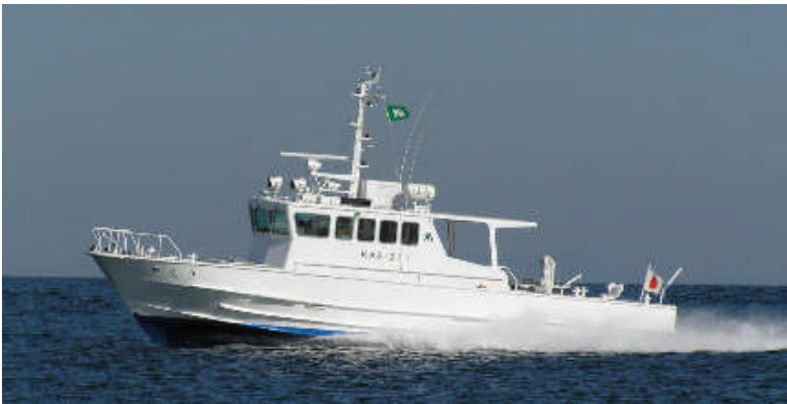
水産調査船「やくり」