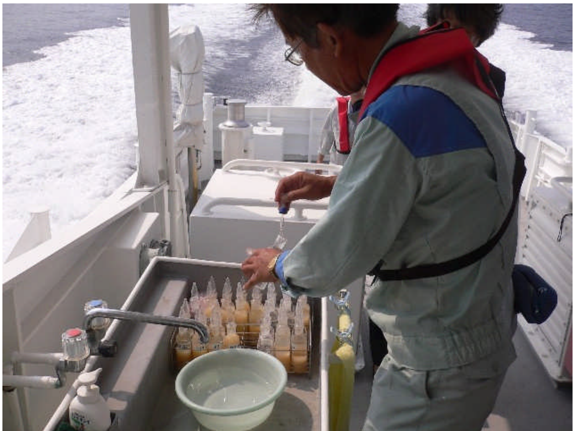
溶存酸素 固定処理