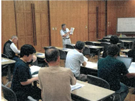
経営管理講習会での支援活動

あわせて普及センターでは、当講習会参加者が、計画的な経営管理を行えるよう、講習会の補講を普及センターで開催し、個別の進捗状況等に応じて支援した。