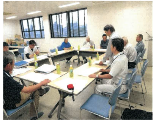
産地分析後の部会との検討

その後、各部会との検討を重ね、新規就農者等、特に支援すべき担い手に対しては、産地の位置付けを認識してもらうとともに、個別支援による課題の共有化及び今後の生産技術の改善点等の助言を行った。あわせて、それ以外の農業者に対しても改善すべき点を取りまとめた資料を作成し配布した。