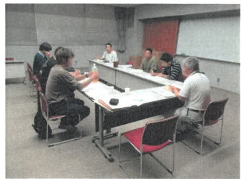
新規就農者に対する相談・支援活動

ってはそれらの性能や規模適確性、資金繰り等について慎重に検討した。その際、認定新規就農者には、自ら中期的な収支計画等を作成するよう促すなど、計画作成の段階で適宜必要な助言等を行い、計画を達成させることができるよう留意した。