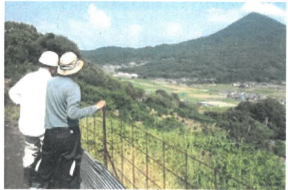
イノシシ侵入防護柵点検の様子

農作物被害が大きいイノシシに関しては、地域ぐるみで対策に取り組み大きな効果をあげているものの、対策がとられなかった場合は、営農活動の中止による耕作放棄地の拡大等が懸念される。このため、農業者の営農意欲の低下を招かぬよう鳥獣害対策に関する知識を持ってもらい自ら対策に取り組めるよう関係機関と連携し、情報の共有化を図りつつ啓発活動に重点を置くこととした。