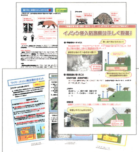
図2 市町などへ配布したチラシ等一部

また、集落全体で対策を推進することが効果的であることから、集落での話し合いや地域ぐるみの取り組みを促進する啓発資料を作成し、対策の推進を図った。