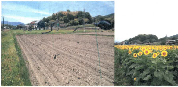
ヒマワリのハト対策試験展示の様子