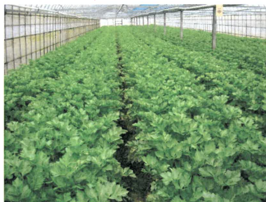
養液土耕栽培のセルリー（揃いが良い）

発生が問題となったが、育苗時のアブラムシ類の吸汁によるウイルス病であることが判明した。育苗時のアブラムシ対策の対応と伴に斑点病、菌核病、萎黄病、ハクサイダニ、ヨトウムシ類など問題になった病害虫の対策を行い防除体系の確立を図った。