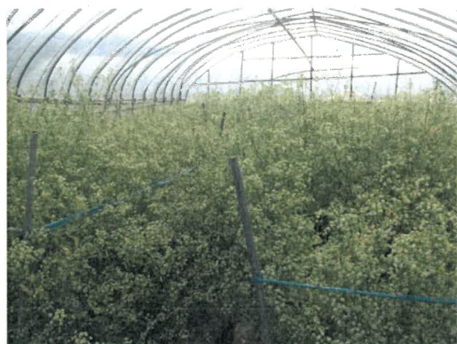
セルリー採種（収穫1週間前）

導入当時は、種子の発芽が上手くいかなかったが、発芽時の温度管理や育苗培土の改善に努めたことにより、育苗ポットでの育苗が定着した。しかし、高温になると種子の発芽が一定しないことから、育苗センターで発芽苗の試験を行い、生産者が発芽苗を購入するようになった。また、128穴のセルトレイでの育苗を検討し、育苗センターで苗の供給が可能になったことで、生産者は育苗を全量委託できるようになり、生産者の育苗負担はなくなった。しかし、平成20年頃に育苗センターで、苗の生育障害が見られ始めたことと、発芽率の低下を受け、種子の系統選抜と長野県で採種の研修を行い、地元での採種体系を確立したことにより、問題解決を図った。