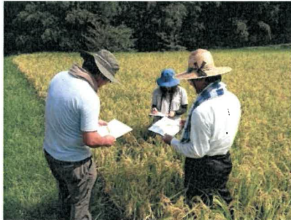
成熟期を検討（東讃管内）