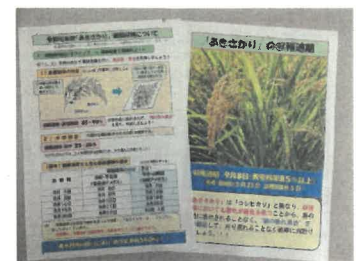
「あきさかり通信」vol. 6 (適期収穫編)

特に、「あきさかり」は「コシヒカリ」と異なり収穫時期においても葉色を濃く保つことから、「葉の緑色に惑わされることなく、穂の熟れ具合を良く見る」ことが重要で、成熟期の写真を入れた「収穫適期のチラシ」を作成・掲示し、適期刈取りを推進した。