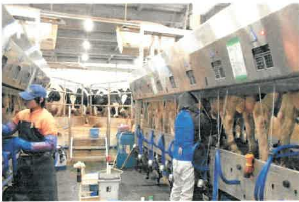
作業マニュアルを作成した搾乳作業

次に、作業のマニュアル化に取り組むこととし、最初に一番重要と思われる「搾乳マニュアル」の作成から着手した。安全でおいしい牛乳を生産するためには、操作ミスや見落としのない搾乳作業を、毎回・毎日継続することが必要である。搾乳施設には、多くのスイッチやバルブがあり、大型経営の場合、複数の従業員が操作するため、伝言や伝達だけでは、忘れや勘違いによる、操作ミスが発生する可能性がある。そこで、作業マニュアルを作成し、勘違いなどによる誤操作の発生を防止することにした。