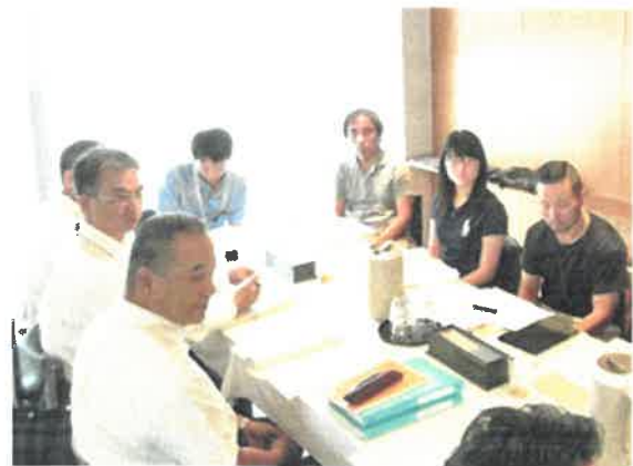
従業員にGAPについて説明

まず、従業員が、GAPの内容を理解することが必要であることから、説明会を開催した。GAPは農家ごとに異なるため、具体的な内容を、継続的に学習、検討、実践することが必要と考え、指導チームでは毎月1回定期的に、検討会を行った。