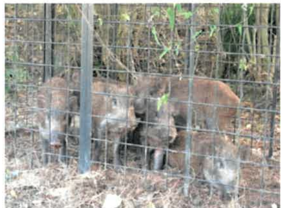
侵入したイノシシの捕獲

侵入防止柵の改善とともに、狩猟者の協力による継続的な捕獲により、集落内に生息するイノシシの数は、農作物被害の状況からみて減少傾向にあると考えられる。