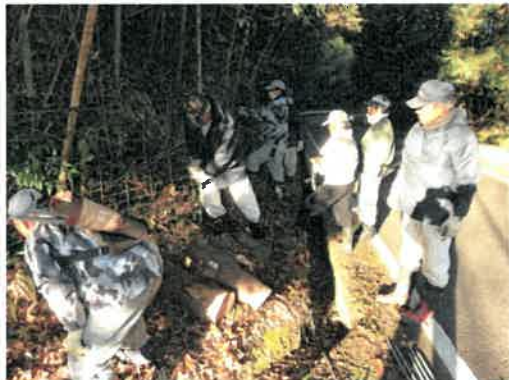
侵入防止柵の一斉見回りの様子

柵の維持管理では、平成26年度には柵周りの草刈を年に2回行うよう申し合わせができた。さらに、平成28年度からは集落有志による一斉