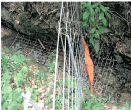
柵下水路へのワイヤーメッシュの敷き込み対策

学習会などでの情報提供により、個々に侵入防止柵の見回りを増やすなど関心の高まりがみられるようになった。平成25年1月には、学習会で対策を紹介していた柵下の水路にワイヤーメッシュの敷込み対策が有志により行われた。対策後の普及センターによるセンサーカメラを使った調査では、イノシシの通過をかなり制限できていることが確認できた。また、平成30年度にも別の場所からの侵入が疑われたため、同様の対策が行われた。