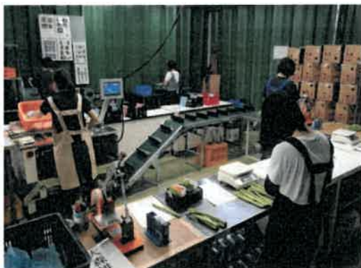
自動計量機導入による出荷調整作業支援

さらに、平成29年から30年にかけて作業レイアウトの見直しを行い、作業員の動作環境を改善したことで、効率的に作業支援を行えるようになった。