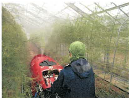
小型スピードスプレーヤによる防除作業支援

また、広い通路幅を活かして、平成30年より、小型スピードスプレーヤ(SS)を使った、JAによる病害虫防除支援も始まった。