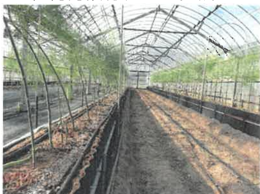
新植後収穫1年目、4月の立茎

平成30年度末では、生産者18名、栽培面積2.5haとなっており、次年度以降も新植が予定されるなど、今後も作付拡大が進む見込みである。