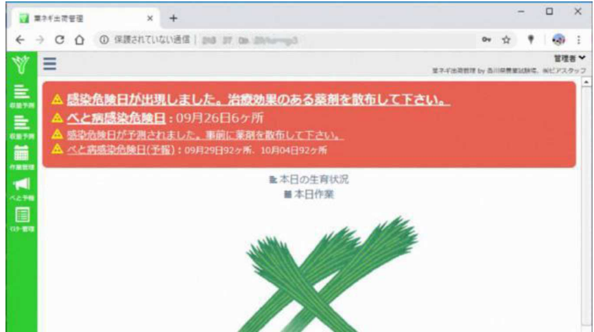
図3 感染危険日および感染危険日の予測が出た場合のトップページの警告表示

また、「べと病予報」のボタンをクリックすると予め登録しておいた圃場の地番が、べと病に対して対応済みか未対応かに分かれて表示され、圃場ごとに防除の判断を支援する仕組みになっています(図4)。