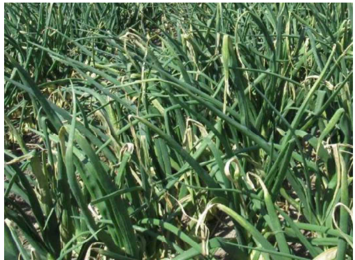
写真1 タマネギべと病の発生圃場

平成28年に本県でネギとタマネギのべと病が大発生し、大きな被害がもたらされ、べと病に対する効果的な防除技術の確立が求められました。一般的に農作物の病害虫の多くは、気象条件によって発生する時期や量が変動しますが、多くの生産者では、品目毎に策定された防除暦に従って薬剤散布が行われている状況です。このため、適期に防除ができず病害虫が多発生したり、必要以上に薬剤散布している事例が見受けられます。こうした中、ネギとタマネギのべと病について、気象データに基づいて感染危険日を予測し、防除の要否を判断するシステムを開発しましたので紹介します。