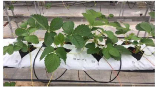
写真2 4倍増殖区の生育状況