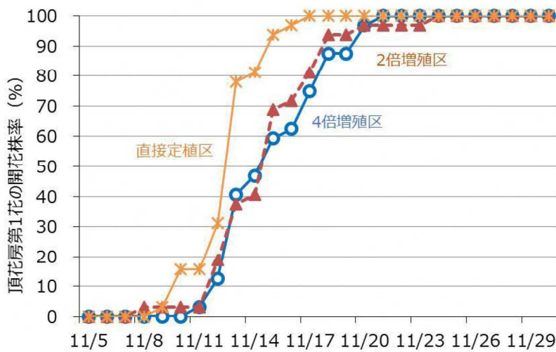
図2 ランナー増殖数の違いが開花に及ぼす影響