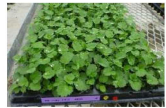
写真1 種子繁殖型イチゴのセル苗

しかし、種苗コストが高いことが課題となることから、育苗の省力化と種苗コストの低減を両立させる方法として、定植するセル苗数を減らし、本圃へ定植後に、セル苗からランナーを伸ばして、子株を増殖させる方法が有望であると考えられました。そこで、らくちん栽培において、種子繁殖型品種をランナーで増殖させた子株を用いて栽培し、開花時期及び収量を調査しました。