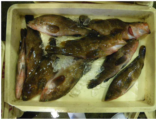
写真1 キジハタ（アコウ）

【はじめに】香川県で「アコウ」と呼ばれているキジハタは初夏から夏に多く漁獲されます（写真1）。近年、香川県では全長約5cmの稚魚約12万尾を毎年放流しており、漁獲量が増加しています。本種は青森以南から東アジアの沿岸域に生息し、全長50cm程度に成長するハタ科魚類です。また、本種は雌から雄へと性転換する魚種であり、産卵期推定や性別判断には、生殖腺の組織学的観察が必要とされます。今回は天然海域のキジハタの産卵期を明らかにしたので紹介します（山本・小林 2017）。