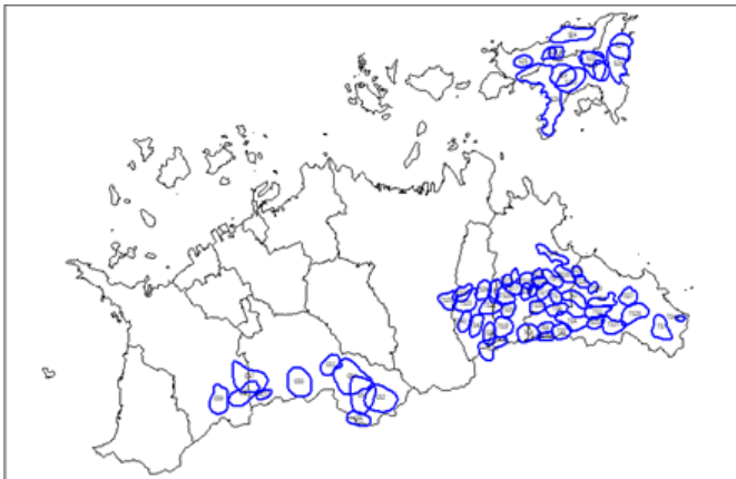
香川県内のニホンザル群れ分布(生息状況調査)