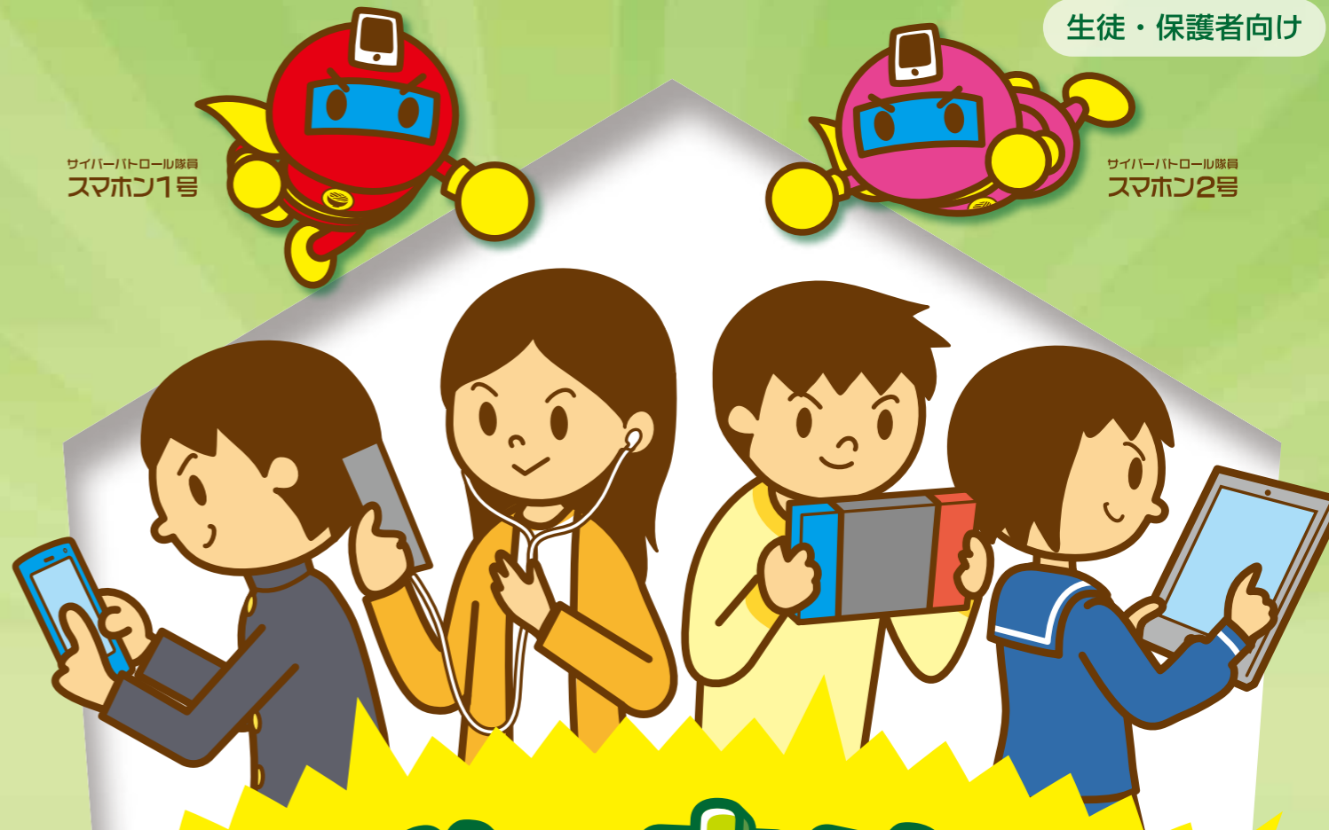
サイバーパトロール隊員 スマホン1号