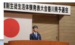
香川県予選会 香川県立三木高等学校生活体験発表大会