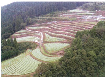
※写真は、2018年の島ヶ峰の様子です。