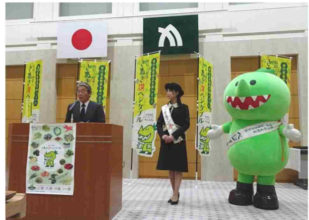
本部会は、1月31日に、県産野菜のイメージアップに取り組む「さぬき讃ベジタブル」認定生産者となりました