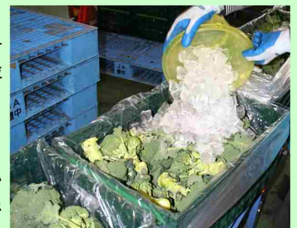
集荷場での氷詰めの様子

香川県は、全国一の品質を誇っていると自負しています。どこにも負けない産地を作って頑張っていきますので、ぜひ美味しい県産ブロッコリーを味わってください。