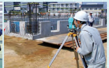
インターンシップ(建築科)