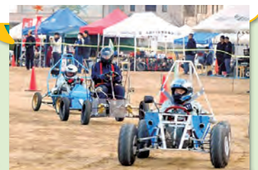
ものづくり技術部(ゼロハンカー)

【大学】国公立・・・1人 / 私立・・・15(内短大1)人 【専門学校】・・・19人 【就職】香川県内・・・50人 / 香川県外・・・7人