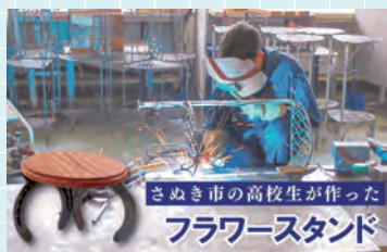
ふるさと納税返礼品の制作

四国遍路最後の札所である市内3つのお寺を巡る遍路ウォークでは、地域の歴史や伝統、現在について学ぶとともに、地域の方たちとふれあえます。商業科、工業科それぞれの学びの成果を披露する志度高祭には多くの方が来校します。