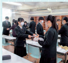
ビジネスマナー講習

すべての学科において、地元自治体や商工会、企業、大学等から講師を招き、最新の知識や技術、社会人として必要な心構えなどを学ぶ機会が数多くあります。また、地域の方たちの協力のもと、身の回りの課題について、学んだことを生かしてその解決方法を考える授業を行っています。