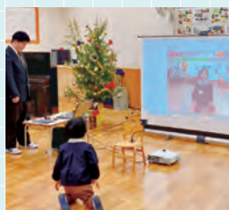
学習成果を生かした園児との交流