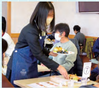
高校生レストラン

総合的な探究の時間「権風」では、小豆島町・土庄町や地域の方々のサポートのもと、地域課題の探究活動に取り組んでいます。課題解決能力など現代社会で必要な様々な力を身に付けます。また、各方面の専門家や地域で活躍する方を招いての講義や実習「わたしのみらいゼミ」、島の魅力や課題を深く掘り下げて探究し、その実現に向け実際に活動する「しまのみらいプロジェクト」、地元の団体とタイアップし、島の食材を使ったオリジナルレシピの料理を提供する「高校生レストラン」など、多彩な活動に自主参加できます。これらの活動を通して、新たな自分や地域の魅力に気がきます。