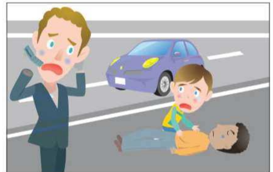
Magkaisa tayong lahat sa pagtulong sa mga taong nasiraan sa daan o naging biktima ng aksidente.