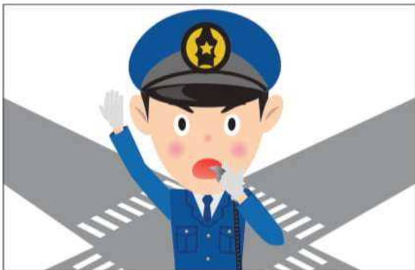
Sundin ang tagubilin ng mga pulis.