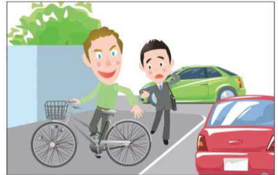
Huwag magtapon ng mga bagay o gamit sa daan na maaring makaabala sa iba.