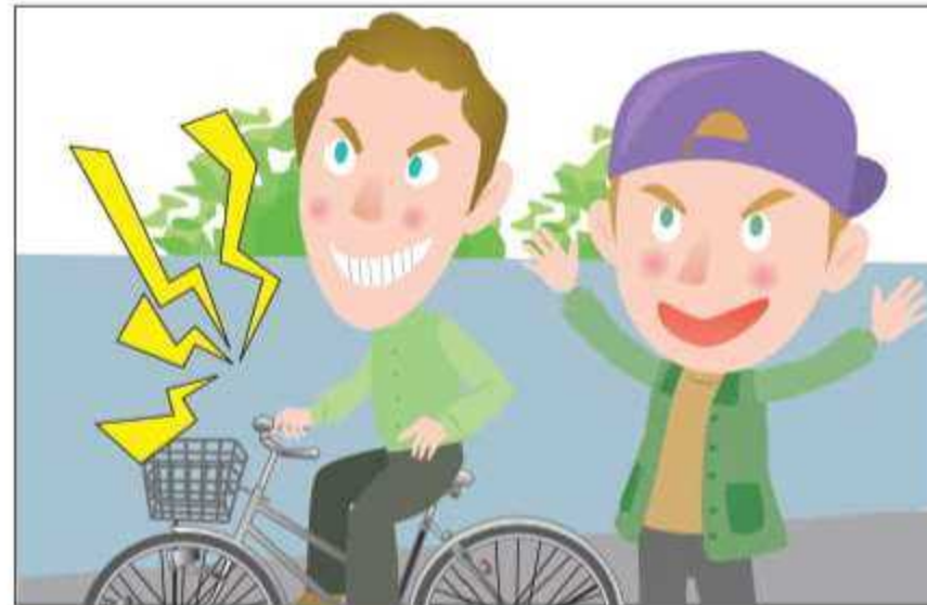
Huwag maging makasarili, at iwasang gumawa ng i ngay at abala sa iba.