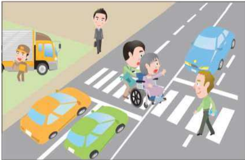
Maging maingat at mapagmatyag sa mga kilos ng mga taong naglalakad gayundin sa ibang sasakyan sa inyong paligid at maging mapagbigay sa iba.

Maraming tao ang dumadaan sa kalsada. Bilang isang miyembro ng sosyalidad kailangan sumunod sa mga patakaran ng trapiko para sa kaligtasan at maayos na daloy ng trapiko.