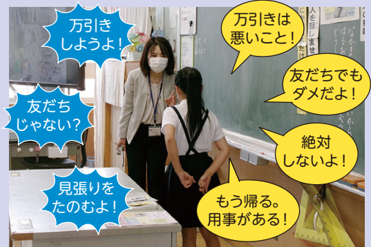
「万引きをさそわれた場面のロールプレイ」