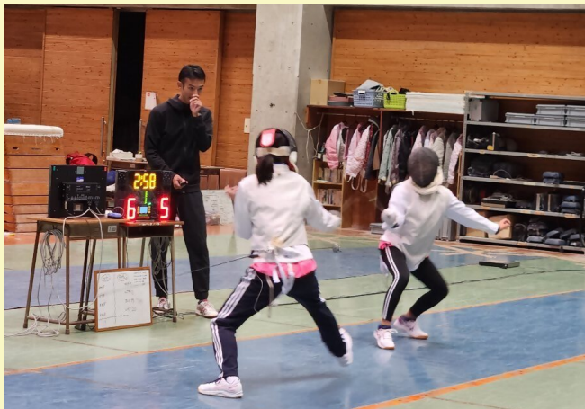
競技体験：フェンシング（場所：高松北高等学校）

県内の小学4、5年生を対象に募集し、書類審査と体力測定等により選考された児童をスーパー讃岐っ子として認定します。小学校では接する機会の少ない競技の体験や身体の基礎能力を伸ばさせることをねらいとしたプログラムを月に2回程度実施しています。また、子どもたちをサポートする保護者の方にも、スポーツ障害や栄養学などの講義を受講していただいています。