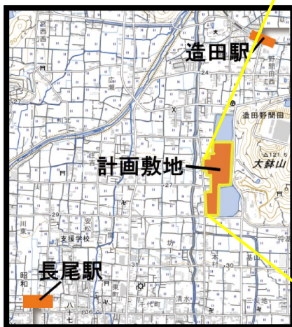
▶地理院地図(国土地理院)を加工して作成