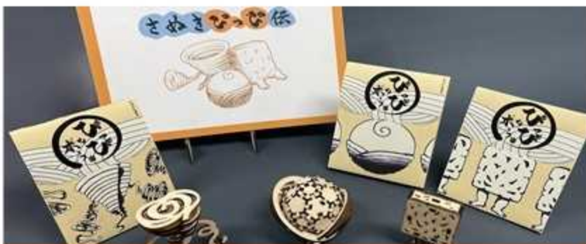
「表現力」に磨きをかける普通寺第一高校のデザイン科は世界的大会でも優秀な成績を収めるとともに、新たな挑戦を続けてい