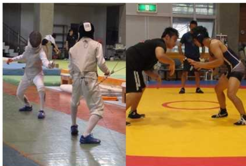
スーパーアスリート支援プロジェクトを実施している高松北中学・高校では東京、パリと2大会連続でオリンピックを輩出している。

「こんな生徒に来てほしい」、「うちの学校ではこんな学びができる」、「うちの学校を卒業したらこんな力が身につきます」というそれぞれの学校の教育活動の方向性を示したものをスクール・ポリシーといいます。