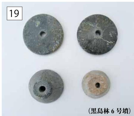
(黒島林 6 号墳)