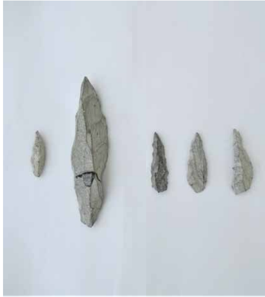
旧石器時代 角錐状石器 縦 3.8 ~ 11.7(cm) × 横 1.1 ~ 3.0(cm) × 厚 0.6 ~ 2.0(cm)