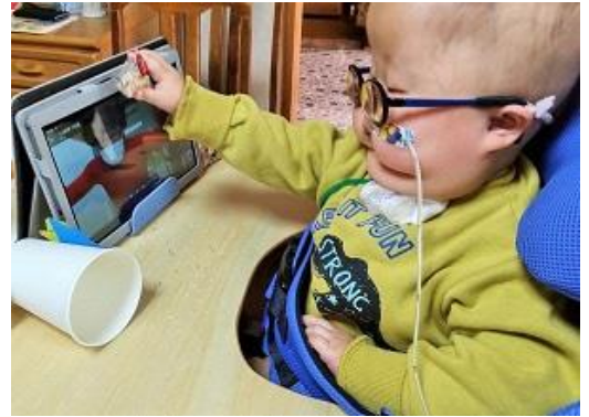
ICTを活用した教育の推進

障害のある児童生徒の個々のニーズや障害特性に応じた学習支援を保障するために、ICT環境を整備し、特別支援学校におけるICTの利活用を進めるとともに、主体的な学びを支えています。