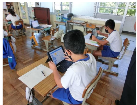
タブレット端末を活用した授業