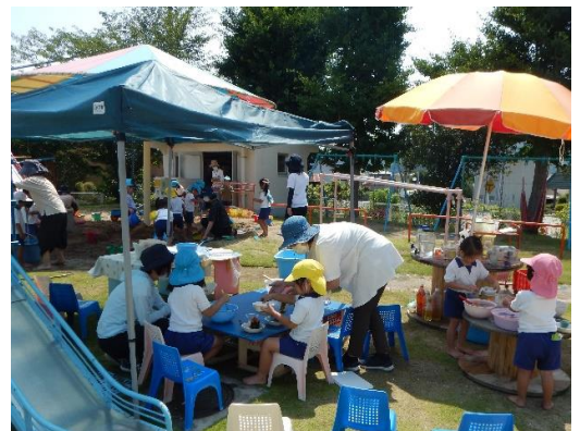
自発的な遊びの中での学び