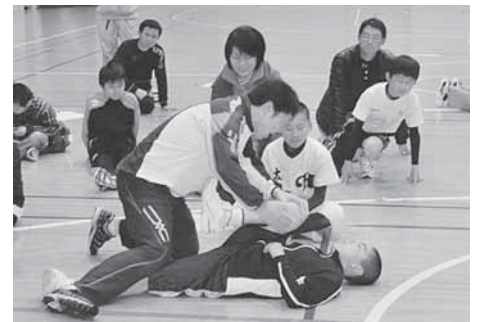
スーパー讃岐っ子育成プログラム (コンディショニング)

平成21年度から、県内の小学生を対象に、運動に取り組むきっかけづくりと体力向上の方法を学ぶ機会を提供する「体力向上プログラム」を実施しています。また、豊かなスポーツの素質を持つ小学生を発掘し、専門的な指導者が実施する育成プログラムにより基礎的能力を伸長させ、将来のトップアスリートを育成する「スーパー讃岐っ子育成プログラム」を実施しています。今年度は、小学校4年生36名が第5期スーパー讃岐っ子として認定され、様々な能力開発プログラムに取り組んでいます。