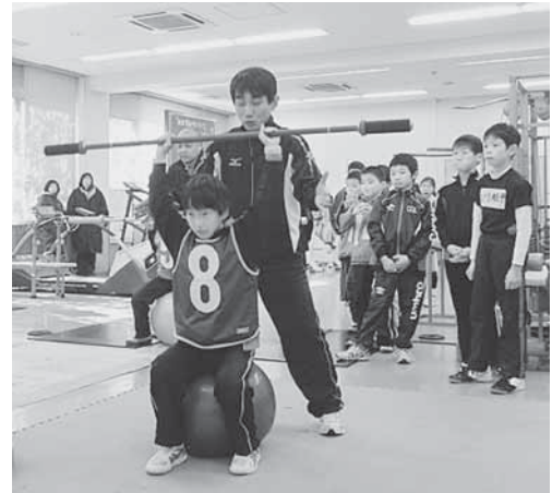
マイスポーツ発見プログラム H25.12.14(丸亀市民体育館)