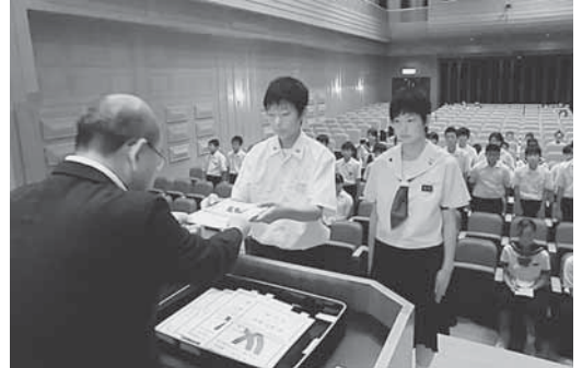
平成25年度TeamKAGAWA指定証交付式

この事業を通じて強化した選手の中には、バスケットボールの全日本男子代表に選ばれたり、フェンシングの全日本選手権で優勝するなど、日本代表レベルにまで育った選手や、レスリングやハンドボールの全日本大学選手権で優勝する選手も育っており、ジュニアからの育成・強化が着実に成果を挙げはじめています。今年度はバドミントン、ソフトテニス、新体操、ウエイトリフティング、水球、アーチェリーの6つの競技を指定しています。