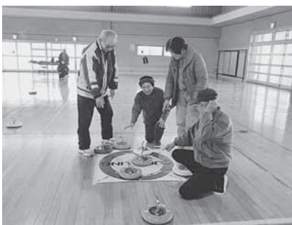
[カロリリング同好会 練習風景]

連絡先 宇多津町教育委員会生涯学習課 電話 0877-49-8007 FAX 0877-49-0618