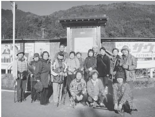
[坂出市 熊野古道ウォーキング]

二日目は本宮大社を参拝した後、中辺路の継桜王子周辺をウォーキングしました。雲つない快晴の中、「野中の清水」や「とがの木茶屋」を見ながら、大