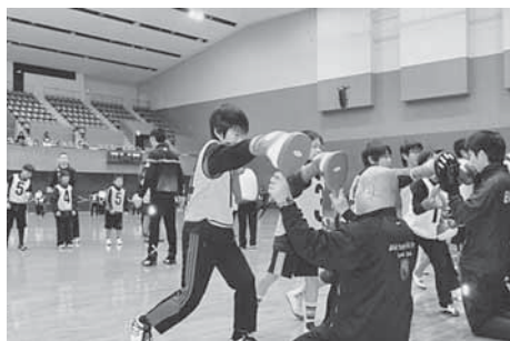
マイスポーツ発見プログラム