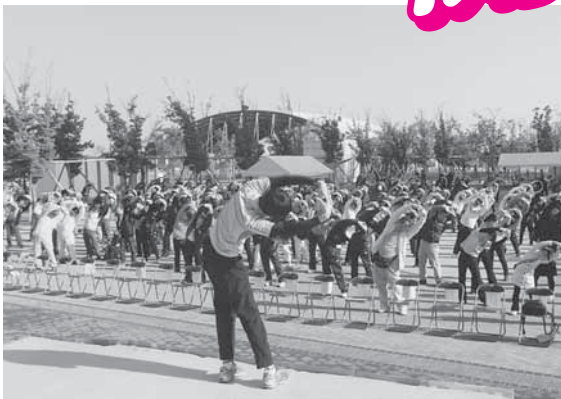
第24回県民スポレク祭 H25.11.17(サンポート高松)