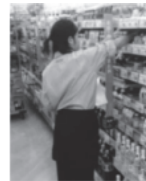
産業現場等における実習