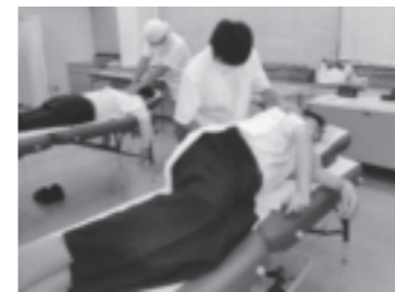
医療科 校外医療実習