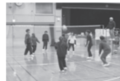
津島杯(クラスマッチ)

本校定時制課程は、「3年修業制」と「4年修業制」を選択できることや、「秋入学」・「秋卒業」の制度があることが特徴です。生徒一人ひとりの個性を大切に、それぞれの目標実現をサポートします。定通軟式野球大会や定通総合体育大会、生活体験発表会など定時制独自の行事もあります。校内では、津島杯（クラスマッチ）や、全日制・通信制と合同の斯文祭（文化祭）を実施しています。