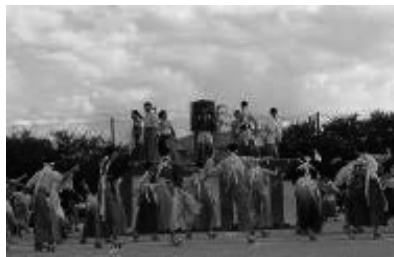
観一祭 デカンショ