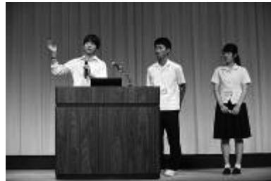
SSH 全国発表会 審査委員長賞受賞