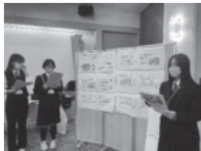
四国まんなかサミット発表の様子