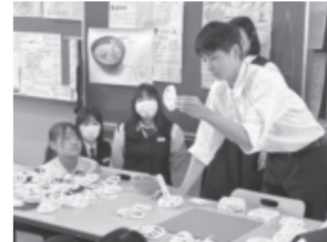
令和5年度課題研究 製品開発風景