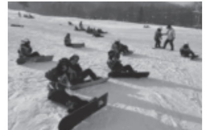
スキー・スノーボード研修(修学旅行)

3泊4日の北海道への修学旅行では、体験学習としてのスキー・スノーボード研修と、札幌・小樽での自主研修をします。また、生徒会を中心として文化祭、体育祭、球技大会などが企画・運営され、これら多彩な行事が青春の1ページを鮮やかに飾っています。善通寺支援学校との音楽交流会、本物の芸術に触れる芸術鑑賞教室や各界で活躍している卒業生を講師に招いて教養講座を実施し、豊かな人間性の育成を図る機会としています。