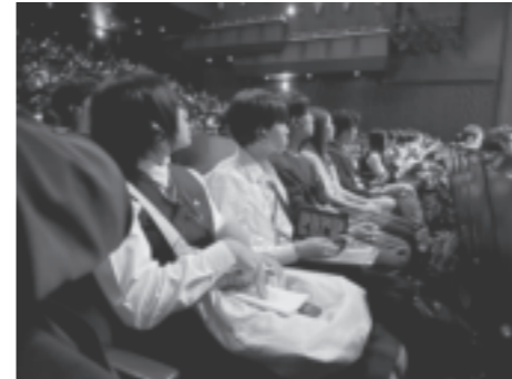
Motion Plus Design TOKYO2023 への参加

デザイン科では、実習、工芸絵画、工業技術基礎などの授業の中で、デザイン分野に必要とされる専門的な知識と技能を身につけるとともに、デザインに関する多くの科目をより専門的に学習しています。さらに、日頃の学習を深めるため、外部講師による講演会や県外研修なども実施しています。そして、これらの成果をデザイン科作品展をはじめとするさまざまな場で発表しています。また、専門性を高めるだけでなく、普通教科・科目を多く学習できる「国公立大学等への進学に対応したコース」を設けることにより、さまざまな進路希望の実現に努めています。また、課題研究では県内の市町等と連携して様々なデザインに取り組み、それらの活動が県に評価され、令和3年4月に知事表彰「かがわ21世紀大賞」を受賞しました。