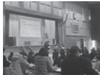
探究最終報告会(2年)