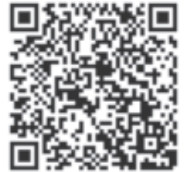
デザイン科チャンネル (YouTube)