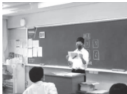
プレゼンテーション大会

さらに、地域の自治体等と連携した探究的な学習に取り組んでおり、自立した社会の一員として自ら課題を見つけ、主体的に社会に参画する態度を育成するため、「他者と協働して課題を解決しようとする学習活動」を積極的に進めています。