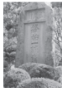
校訓碑「終始一誠意」

何事にも一つの誠意をもって最初から最後まで取り組み、心身ともに健全で、将来の日本や国際社会の中で指導的な役割を果たせる人材の育成をめざしています。