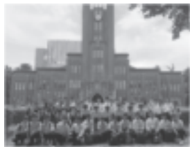
東京方面へのキャンパスツアー 東京大学本郷キャンパス 安田講堂前にて

生徒のほぼ全員が大学への進学をめざしています。2年次から文科系、理科系のコースに分かれて進路や適性に応じた学習ができるような教育課程を用意しています。また、丁寧で分かりやすい授業をめざし、 65分授業 を実施しています。さらに、進路意識を高めるために様々な大学への「大学訪問」や「キャンパスツアー」などを実施したり、学習を支援する「 斯文土曜塾 」(難関大受験対策セミナー)など、自主的に学習に取り組める機会を数多く設けています。本校では、合格できる大学ではなく、一人ひとりが 進学したい大学 に向けての進路指導を行い、生徒は高い志をもって勉学に励んでいます。近年の主要大学の合格実績は右表の通りです。