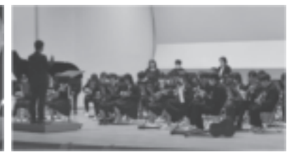
芸術科学習成果発表会