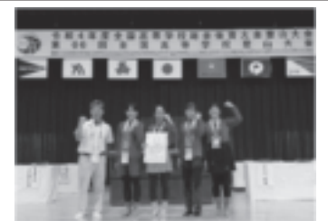
ワンダーフォーゲル部 (令和4年度全国総体にて)