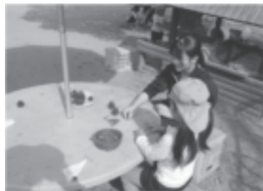
(香川大学教育学部附属坂出幼稚園、同小学校での支援活動)