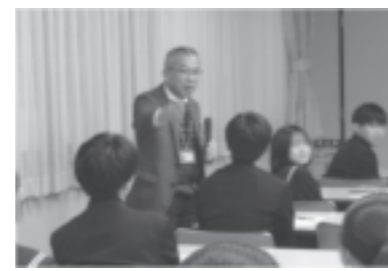
(香川大学教育学部教授による講義)