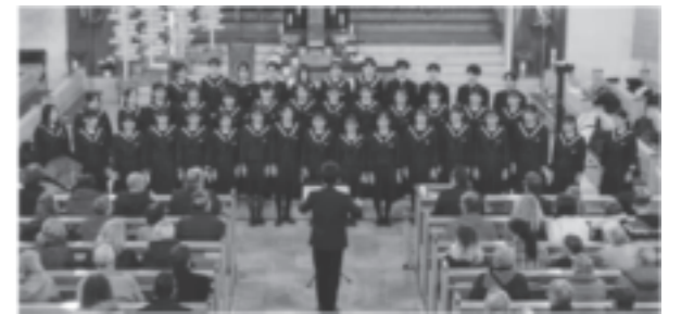
(海外交流演奏旅行 現地校との交流演奏会)

ドイツ・オーストリアへの演奏旅行は、現地の音楽高校生との交流や合同演奏会に加え、ドイツでのホームステイ、オペラや名門オーケストラのコンサートを鑑賞、また音楽家の足跡をたどるなど、音楽の本場での素晴らしい体験と学習からなる感動の9日間です。(令和6年4月21日～4月29日実施)