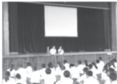
探究活動成果発表会

社会の激しい変化に対応できるよう、豊かな国際感覚を養うとともに、課題を発見し探究する力や社会に貢献できる実践力を育みます。グループごとに研究テーマを設定し、県内外でのフィールドワーク、分野別講演会、外国人との交流イベント等を通して視野を広げ、探究を深め、3年生ではその成果を発表したり、自ら実践したりするなど、地域に貢献していきます。