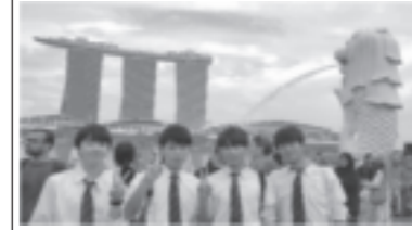
修学旅行(シンガポール)