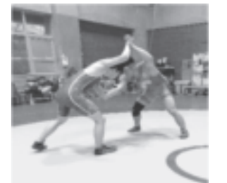
レスリング部 (U17世界レスリング選手権大会 個人優勝)