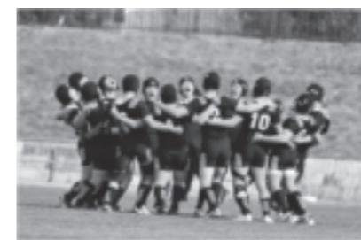
ラグビー部 (全国大会勝利)