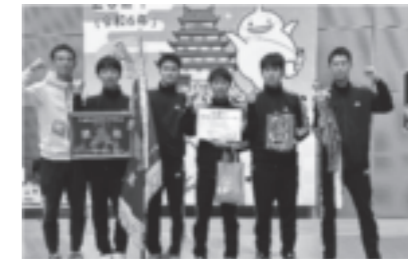
フェンシング部 (全国高等学校選抜大会 学校対抗 男子エベ優勝)

吹奏楽、合唱、理学、図書文芸、新聞、放送、美術、書道、家政、写真、漫画研究、茶・華道、邦楽、応援