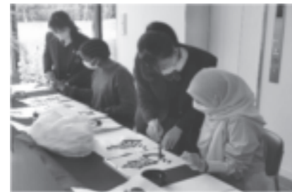
グローバルエキスポ (文化部合同で外国人に日本文化を紹介)