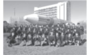
科学研修(つくば・東京)