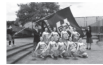
応援部 (チアは全国大会出場)