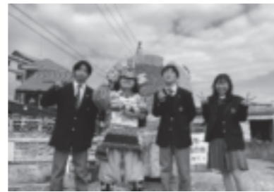
地域の小学校のイベントに参加