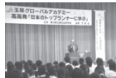
玉翠グローバルアカデミー