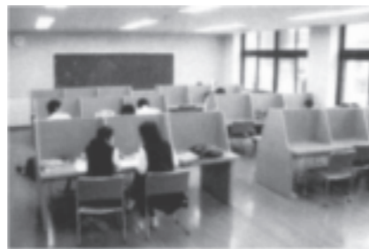
メディアセンター

白亜の近代的な校舎内には、生徒が自主的に学習活動できるよう、整った学習環境が用意されています。充実した図書室のほかに、各フロアには、教科ごとの職員室に隣接したメディアセンター、コモンスペース、ゼミ室があり、生徒の学習や課外活動の場として大いに活用されています。普通教室には空調設備が設置され、快適な学習環境のなかで、生徒が自ら学ぶ活動が行われています。また、セミナーハウス「アルカディア」も、生徒の合宿研修やHR活動などで利用され、豊かなスクールライフを送るのに役立っています。