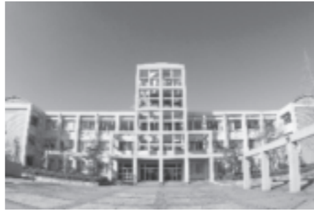
大学のような威風堂々とした校舎 (生徒を中心にした設計に感動)

現在、創立30周年に向かって、高き理想を掲げた学校創立の精神を大切にしながら、これまで以上に「地域で一番行きたい高校」として、新たな飛躍をとげるため、三木町と包括連携協定を結び、更なる魅力づくりに取り組んでいます。自分を発見し、夢実現に向かって邁進できるよう、ICT活用も含めた新しい授業の構築、地域と連携した探究活動やボランティア活動、多くの外部人材を活用した取り組みなどを新教育課程に沿って推進しています。また、語学研修や留学生の受け入れなど国際理解教育も充実しており、ローカルからグローバルまで幅広い視野をもった人材育成をめざしています。以上のように、これからの未来を創る新たな「主役」となる生徒を求めています。