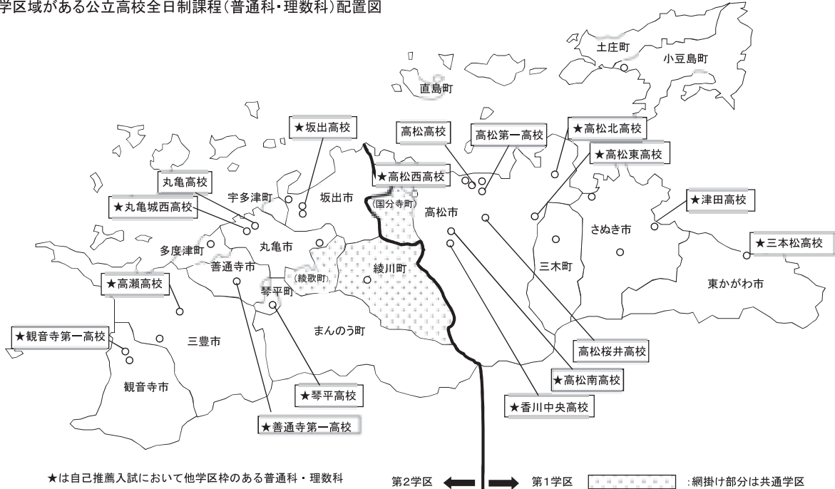
通学区域がある公立高校全日制課程（普通科・理数科）配置図

(2) 公立高校の全日制課程の普通科と理数科以外の学科、小豆島中央高校および定時制課程や通信制課程は、通学区域に関係なく、県内すべての地域から出願することができます。