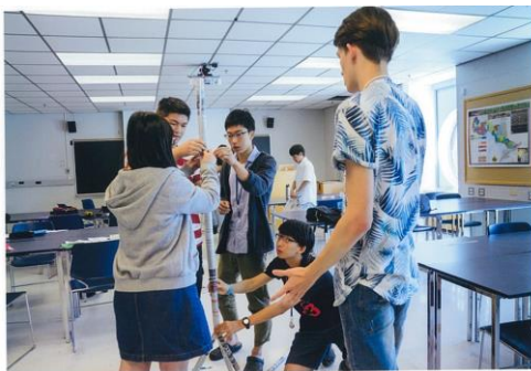
世界中から集まった同年代の生徒たちが、グループごとに与えられた課題に取り組みました。