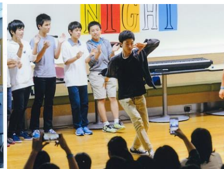
交流会では得意のダンスを披露しました。

カナダのトロントに3週間程滞在しました。海外の人と連絡先を交換したりして親交を深めることができたと思います。将来は、海外に行くと人と関わられる仕事ができればよいと思うようになりました。