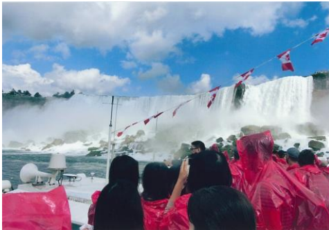
午後はアクティビティの時間。地元の名所をグループで訪れて、実際の英語に触れました。