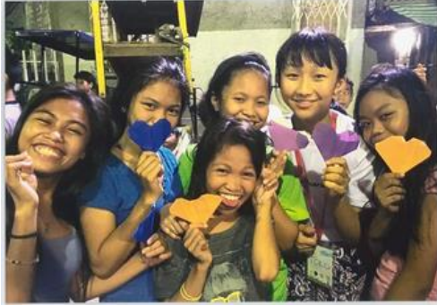
スラム街の子どもたちに折り紙を楽しんでもらいました。