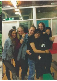
月～金曜日はPCを使った授業、議論中心の授業など多岐にわたりました。EF専用SNSも駆使しながら各国の生徒と英語を学び合い、とても仲良くなりました。

私は、「EF」という団体の語学留学研修を利用し、3週間、イギリスのオックスフォードへ短期留学しました。平日は授業を受け、休日は学校の主催するプログラムに参加しました。将来は、英語を使ってビジネスをしたいです。