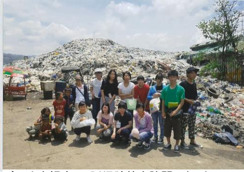
ごみ山を視察し、孤児院等を訪問しました。

海外のボランティア活動を斡旋する「CEC Japan Network」という団体のプログラムを利用しました。フィリピンのセブで貧困層の子どもたちへのボランティア活動をしました。将来貧困に苦しむ子どもたちがゼロになる世界に貢献できるような人になりたいです。