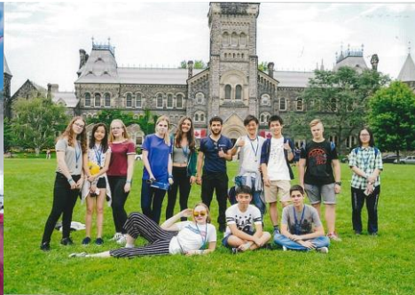
トロント大学の広々とした施設で午前中は英語レッスンを行いました。

私が利用したのは、「毎日エデュケーション」という団体のプログラムで、カナダのトロントに行きました。今まで学校で習ってきた英単語とは全く違う英単語がちらちらと流れていました。はっきりと伝える勇気と思い切って分からないことを尋ねる勇気を得ました。