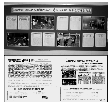
人権コーナーと学校だより

人権コーナーについて知っている児童は77.5%で、そのうちよく見たり読んだりしている児童は全体の40%であった。人権コーナーの設置や人権便りの発行は、学校が人権を大切にしたいなかまづくりを行っていることを児童や保護者に伝えることに効果があったと思われる。