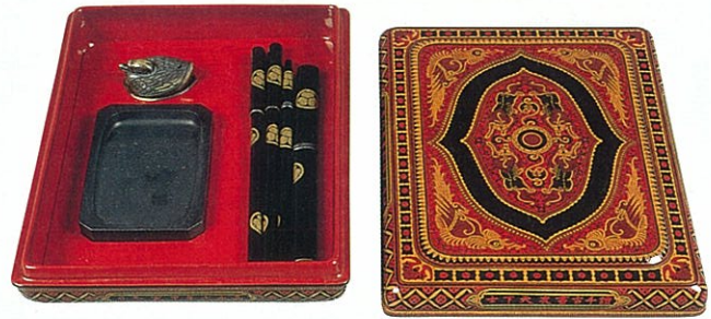
料紙箱と硯箱 玉楯 象谷 作 (香川県文化会館蔵)

下地に布をはったり、細かいもようを工夫したりして、日本で初めて蒔醬を作ることができました。特に、料紙箱と硯箱は有名で、国の重要美術品となっています。料紙とは、物を書くのに使う紙のことです。料紙箱と硯箱で一そろいです。この作品は、竹ひごをかご状に編んで容器を作ってから仕上げたものです。