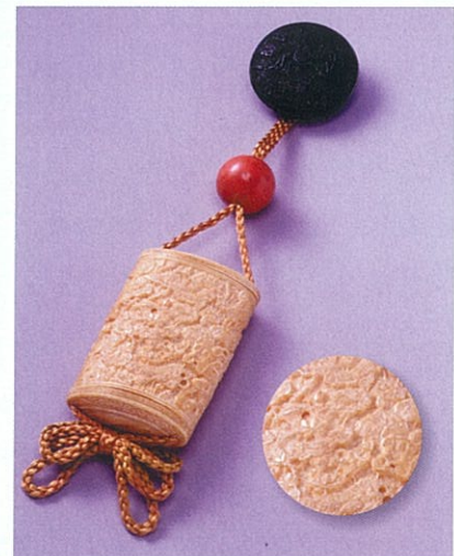
一角印籠 玉楯 象谷 作 (香川県文化会館蔵)

このほかにも、象谷の作品には、りっぱなものがたくさんあります。重要美術品になっている「一角印籠」は、漆の作品ではありませんが、高さ8.6cm、はば5.5cm、厚さ2.9cmの小さな印ろう(薬の入れ物)の表面に、花30個、かめ343匹、かに443匹など1,086点の動植物がほりこまれたものです。それぞれは、今にも動き出しそうなほど生き生きとしていて、見る人々を感心させました。この作品は、象谷がどんなにすぐれたうでを持つ名工であったかを物語っているとされています。