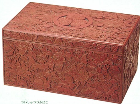
堆朱皺箱 玉楯 象谷 作 (高松松平家資料)

また、殿様に頼まれて、つづみを入れる箱を作った時にも、もようをほるための剣を自分で考えて作り、研石もよく研げるものを探し求めて使い、上に葵の紋(松平家の紋)をほり、その周りと横に、ぼたんやきくの花、それから蝶をうきぼりにしてあります。これは、厚く塗り重ねた漆をほった作品としては、たいへんすばらしいもので、殿様にさしあげると、とても喜ばれたということです。