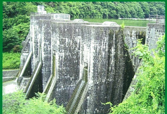
ほうねんいけ おおのはらちょう 豊稔池 (大野原町)