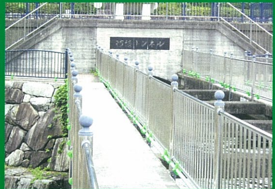
かがわようすい とうざいぶんすいこう さいたちょう 香川用水の東西分水工 (財田町)