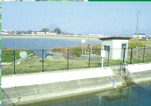
かがわようすい みず ひ いけ まるがめ しあやたちょう 香川用水から水を引く池 (丸亀市綾歌町)