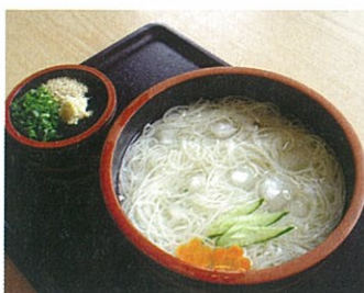
小豆島手延べそうめん