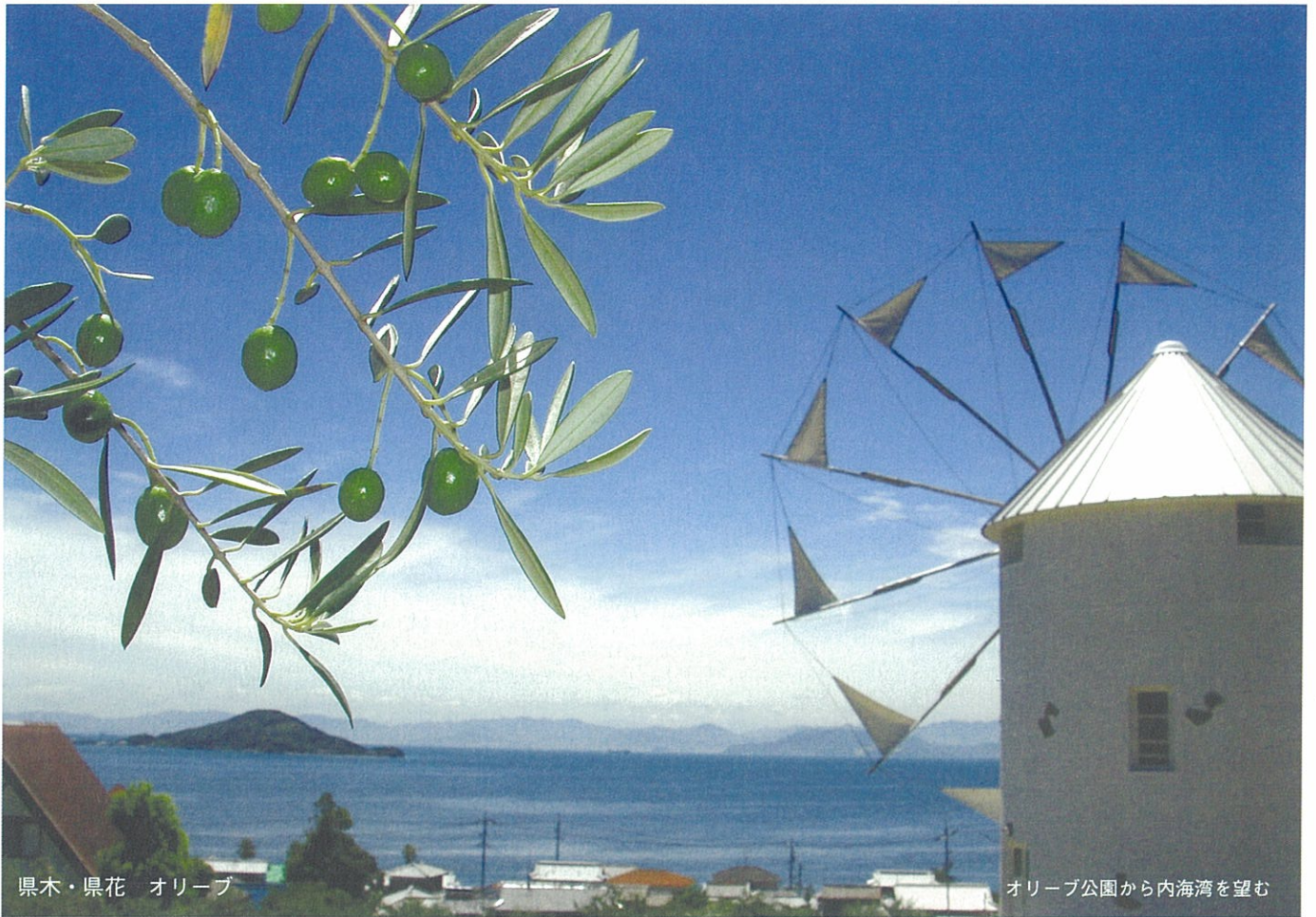
県木・県花 オリーブ