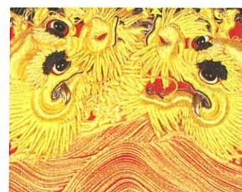
ししゅう 金糸銀糸装飾刺繍