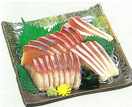
県魚ハマチの刺身