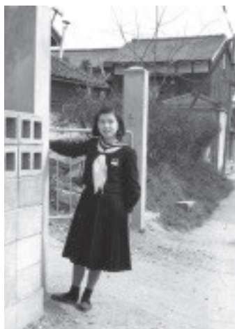
中学校卒業式の日