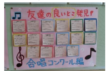
【他に「屋島編」もありました】

各教室、廊下の掲示物も、道徳の時間の学習内容をまとめたものや、生徒の自尊感情を醸成し、温かな人間関係を育むためのものが各所にあり、学校全体で豊かな心の育成