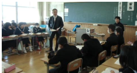
【コの字型に机を配し、話し合う】

考えたり、内容を深めるために心情に訴えかけるビデオの視聴を効果的に取り入れたりする等の活動が行われていました。どの学級も、生徒の発言が多いのが印象的でした。また、終末段階では、本時の学習を振り返り、本時で扱った内容について考えを整理する場が設定されていました。