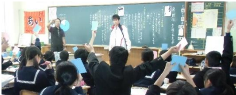
【カードを使って登場人物の行動に意思表示】