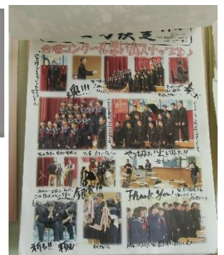
【学級通信：温かなコメント付】

識の向上が見られています。教員が興味・関心を持ち、いい意味でおもしろがって取り組むことが大切だと思っています。」とのお話をいただきました。