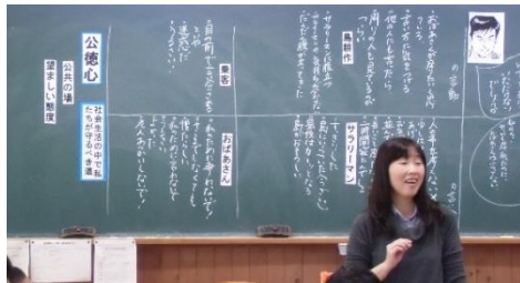
【板書に位置づけられた終末段階のまとめ】

道徳の時間の指導の工夫として、色カードを使って生徒に自分の考えを示させて話し合ったり、役割演技を通して心情を