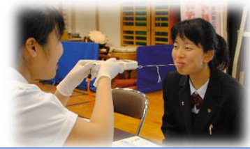
校内歯みがき大会 ～りっぷるくんを使って口唇力測定～ （パ行バ行マ行の発音にもつながる）