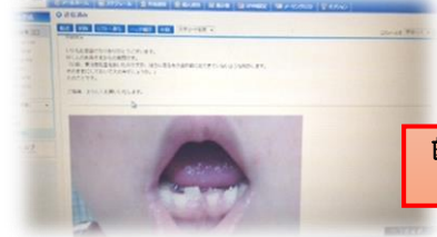
学校歯科医への画像添付メール相談 ～保護者からの質問にも迅速に対応～