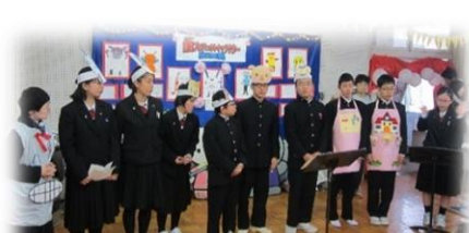
手作りエプロンシアター ～教科（家庭科）との連携～