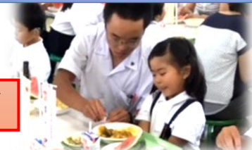
歯ッピー給食 ～お兄さんお姉さんと一緒に楽しく よくかんで食べよう～