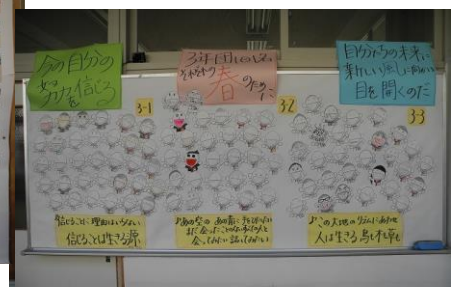
▲各自の目標を掲示し、互いに励まし合う