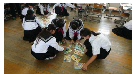
▲自分の課題を再設定する

また、学び合いの場の設定は、誰とでも分け隔てなく互いの話を聞き合う関係をつくるのが、全員参加の授業には不可欠であり、それにより、すべての生徒の学びを保障するという考え方に基づいたものである。男女市松模様の座席配置で4人組をつくり、グループ単位の話し合いがしやすいように机の高さを合わせ、発表のための小ホワイトボードを常備した。そして、授業の中で互いに話を聞き合いながら学びを広げたり深めたりできるようにした。学び合いの場の設定に必然性を持たせるための工夫として、①目的を明確にし、共有すること、②ゴールをイメージさせること、③自分たちで解いた達成感を味わわせること、を挙げて実践に取り組んだ。学び合いの必然性を感じさせる工夫の例として、ワールドカフェ方式で意見を出し合ったり、一人では解決できない課題の追求方法を友だちと協議して決めたり、課題に対する意見や考えを書き残させて、次の活動に生かすようにさせたりした。