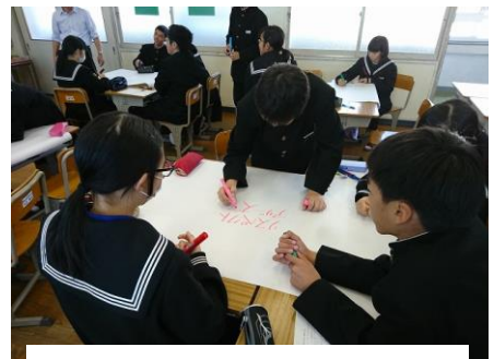
▲ワールドカフェ方式での意見交換