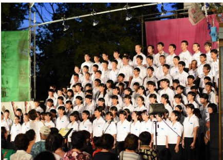
▲地域の行事で合唱を披露