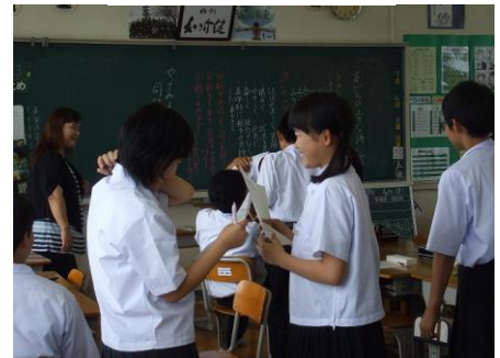
▲大中人権サプリ：上手な仲間のさそい方