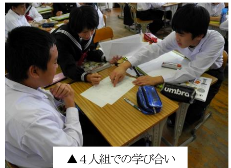
▲4人組での学び合い