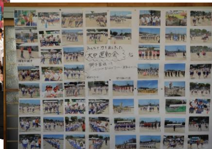
▲運動会での活躍を知らせる掲示物