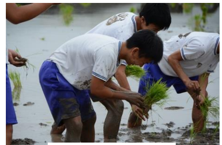
▲田植えをする生徒

これらの取り組みにより、学び合いの場で積極的に周りに働きかけて教えたり、学んだことを他に伝えたりすることができるような「自分には〇〇ができる」という自信を持たせようとしてきた。