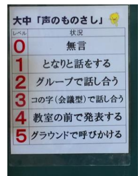
▲大中生のものさし