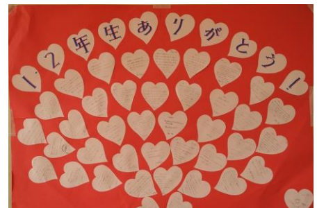
感謝の気持ちを伝えるGOODカード