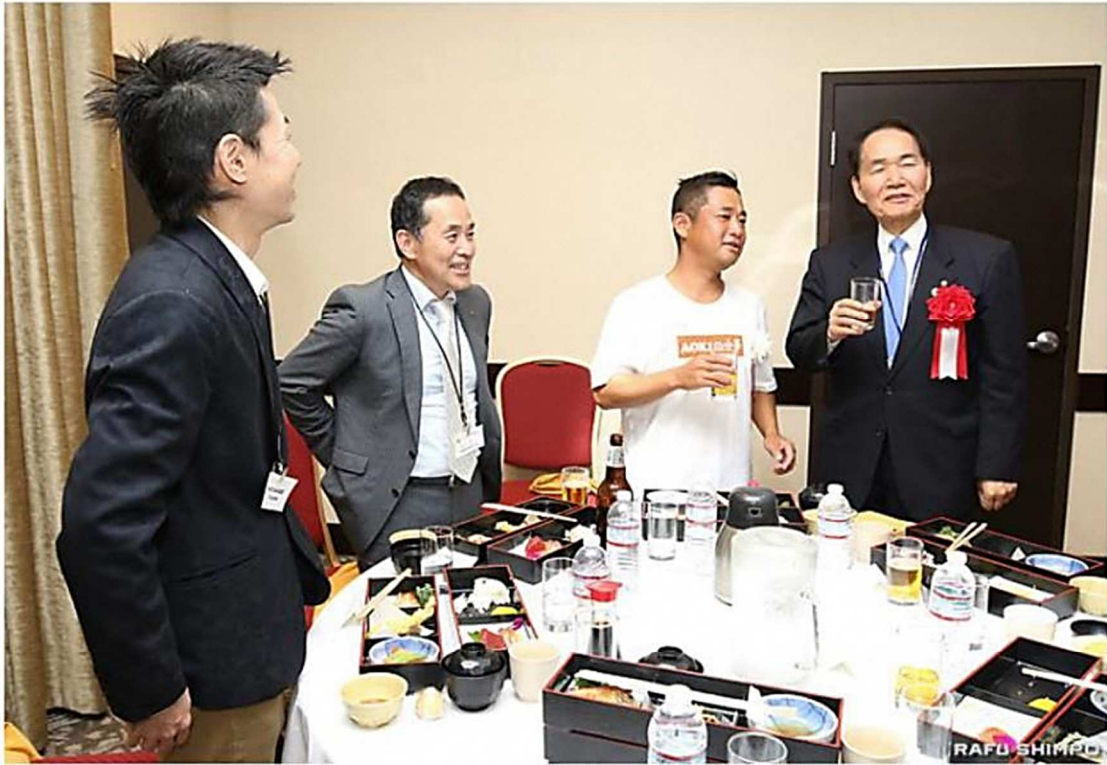
各テーブルを回り、県人会員と懇談する浜田知事（右端）