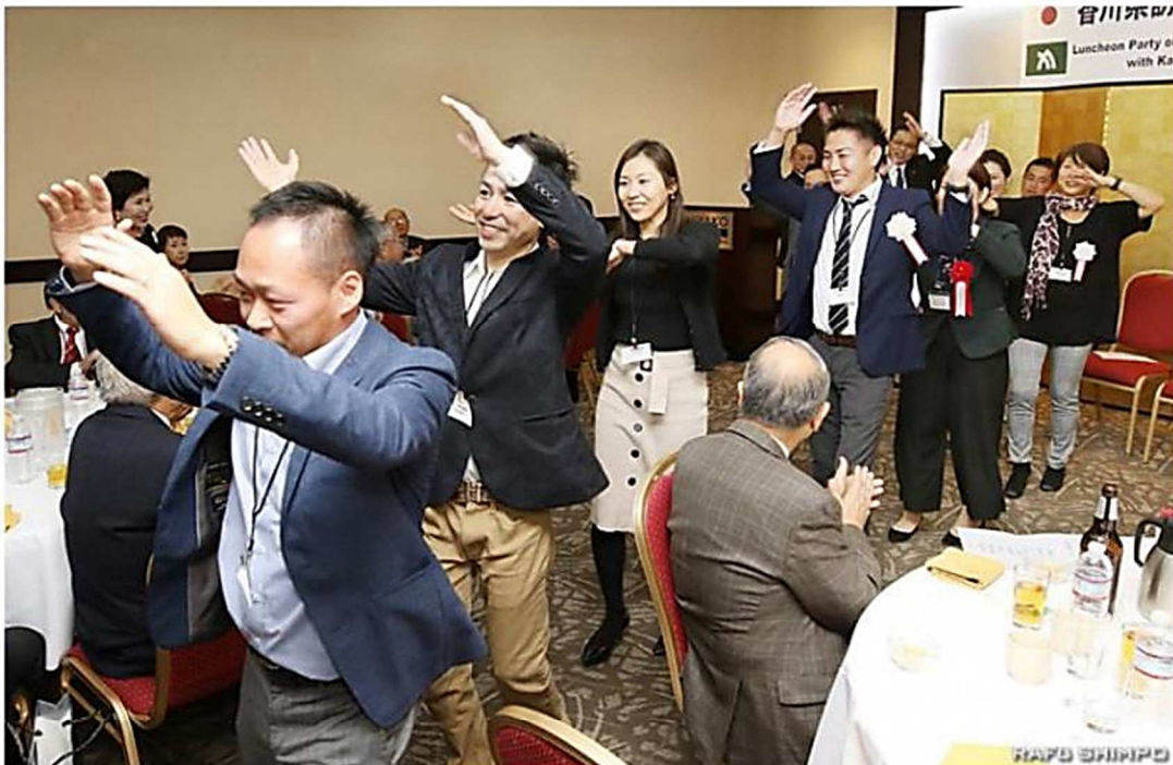
香川の民謡「金比羅船々」を輪になって踊る参加者

3年前に創立100周年を盛大に祝った南加香川県人会（國宗奈緒美、村田ゆき両会長）は、香川県から浜田恵造知事を団長とする県議長と県庁職員からなる訪問団15人と懇談する歓迎会をこのほど、小東京のミヤコホテルで催した。会員約30人が自己紹介をし親睦を深め、香川の民謡「金比羅船々」に合わせて輪になって踊って盛り上がるなど、母県との絆を強めた。