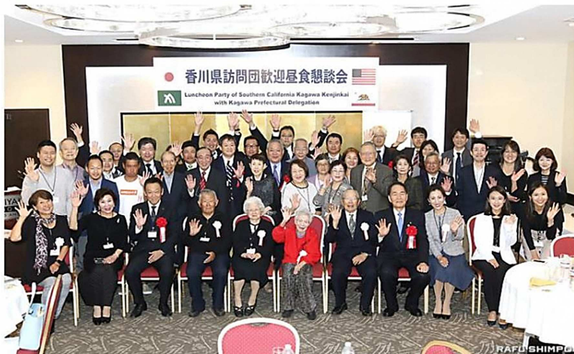
香川からの訪問団を歓迎し、親睦を深めた県人会のメンバーら