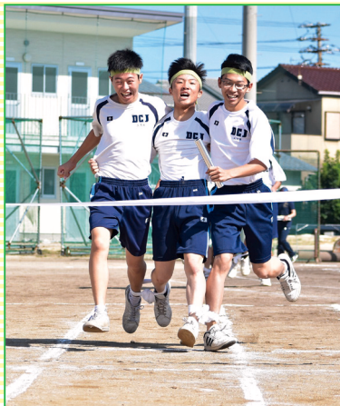
高校生フォトコンテスト 広報委員長賞 「フィニッシュ!」