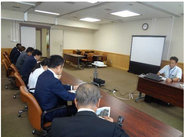
⑦都市公園再整備（県営天神中央公園） ※福岡市役所にて概要説明