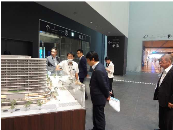
⑤桜町地区第一種市街地再開発事業・花畑広場