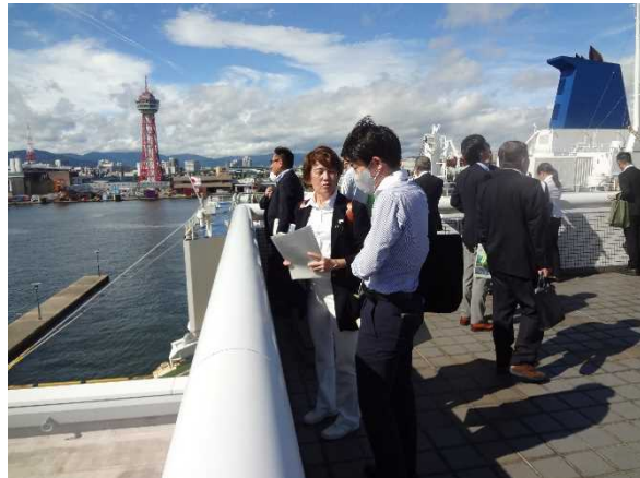
⑥ウォーターフロント地区