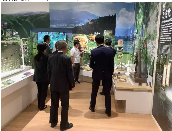
①南阿蘇ビジターセンター