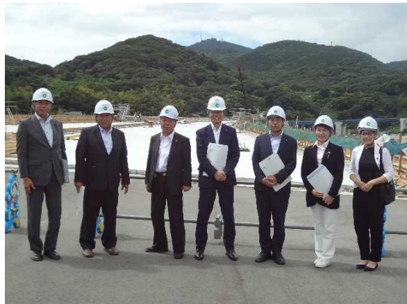
④一般県道池上インター線 池上IC(仮称)